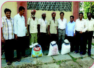
ಮುಗದ ಗ್ರಾಮದ ಫಲಾನುಭವಿಗಳಿಗೆ ಭತ್ತದ ಬೀಜ ವಿತರಣೆ