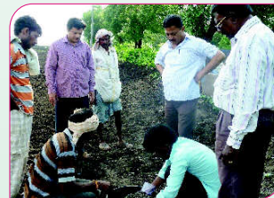
ಸೋಮಾಪುರ ಗ್ರಾಮದಲ್ಲಿ ಹೆಸರಿನ ಬೆಳೆಯ ಬೀಜೋಪಚಾರದ ಪ್ರಾತ್ಯಕ್ಷಿಕೆ