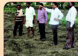
Field visit to cotton FLD at Gongadikoppa village