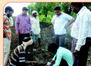
Method demonstration on greengram seed treatment at Somapur village