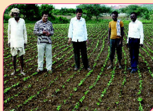
Field visit to Soybean FLD at Jodalli Village