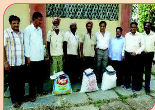
Paddy seed distribution to the FLD participants of Mugad village