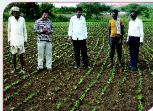
ಜೋಡಳ್ಳಿ ಗ್ರಾಮದ ಸೋಯಾಅವರೆ ಪ್ರಾತ್ಯಕ್ಷಿಕೆಯ ಕ್ಷೇತ್ರ ಭೇಟಿ