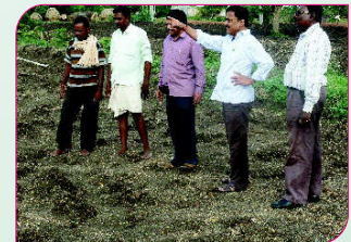
ಗೊಂಗಡಿಕೊಪ್ಪ ಗ್ರಾಮದ ಹತ್ತಿ ಪ್ರಾತ್ಯಕ್ಷಿಕೆಯ ಕ್ಷೇತ್ರಕ್ಕೆ ಭೇಟಿ